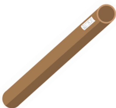
Abbildung 1: Schwer versendbare Sendungen

Um Waren über unsere automatisierten Förderbänder einspeisen zu können, müssen diese vordefinierten Standards entsprechen. Entsprechen Ihre Sendungen nicht den kommunizierten Standards, kümmern wir uns darum, dass Ihre Waren trotzdem in das Netzwerk eingespeist werden können und zum gebuchten Liefertermin unversehrt ausgeliefert werden können.